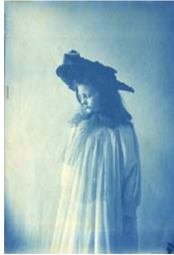
Van Loon in Foam

Echt dicht gaat het museum niet, want vanaf 5 februari opent de tentoonstelling Van Loon in Foam met een uniek overzicht van de fotocollectie van het museum. Veel foto's zullen voor het eerst voor het publiek te zien zijn. Vanaf 1 april gaat het museum zeven dagen per week open van 10 tot 17 uur. Hopelijk bloeien dan de tulpen in de tuin in het kader van het Amsterdam Tulp Festival gedurende de hele maand april. Behalve de Open Tuinen Dagen op 19, 20 en 21 juni is er in juni in het koetshuis een presentatie te zien over de beroemde rijtuigbouwer Schutter & Van Bakel onder de titel Made in de Kerkstraat . In het najaar in het koetshuis een tentoonstelling te zien zijn met portretten uit de Van de Poll – Wolters – Quina Stichting.