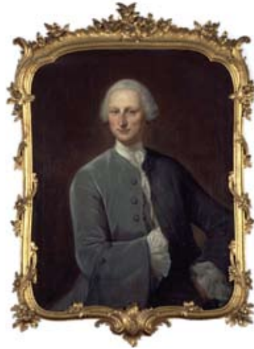
Jan Maurits Quinckhard, Jacobus van de Poll, 1753

Museum Van Loon Keizersgracht 672, Amsterdam Geopend 10.00 - 17.00 uur Meer informatie: 020 6245255 info@museumvanloon.nl www.museumvanloon.nl