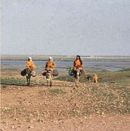
Watermeisjes langs de rivier de Eufraat bij Tell Selenkahiye.